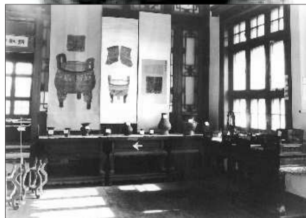
1951年元旦文管会万字会首次展览展厅